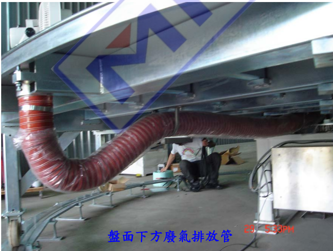
盤面下方廢氣排放管